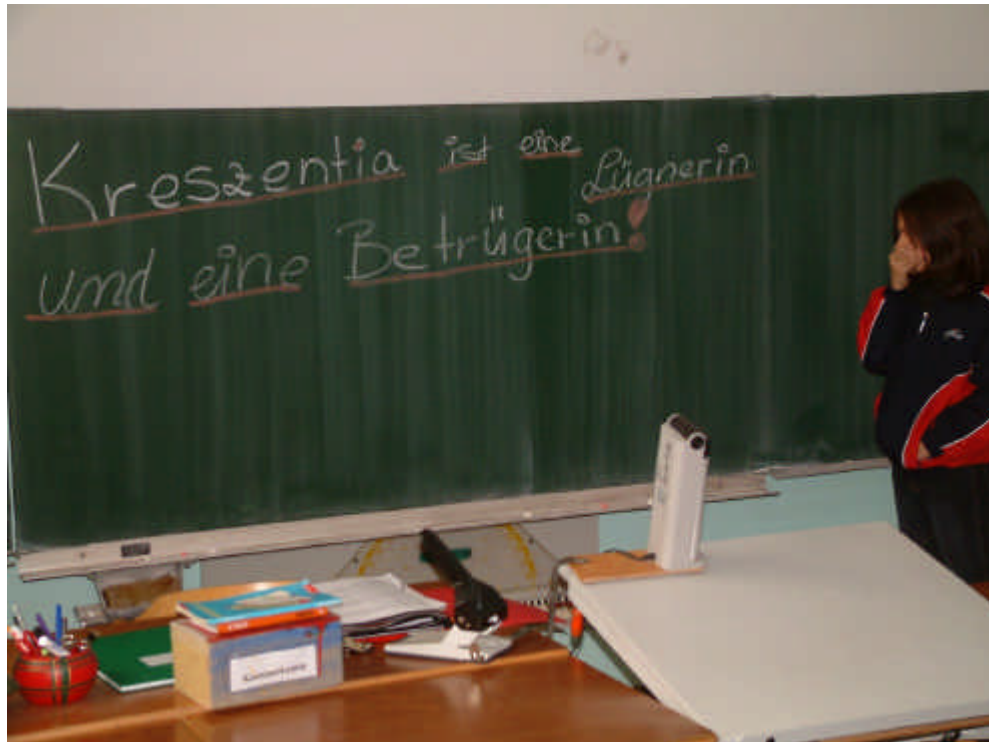
Am nächsten Tag in der Schule